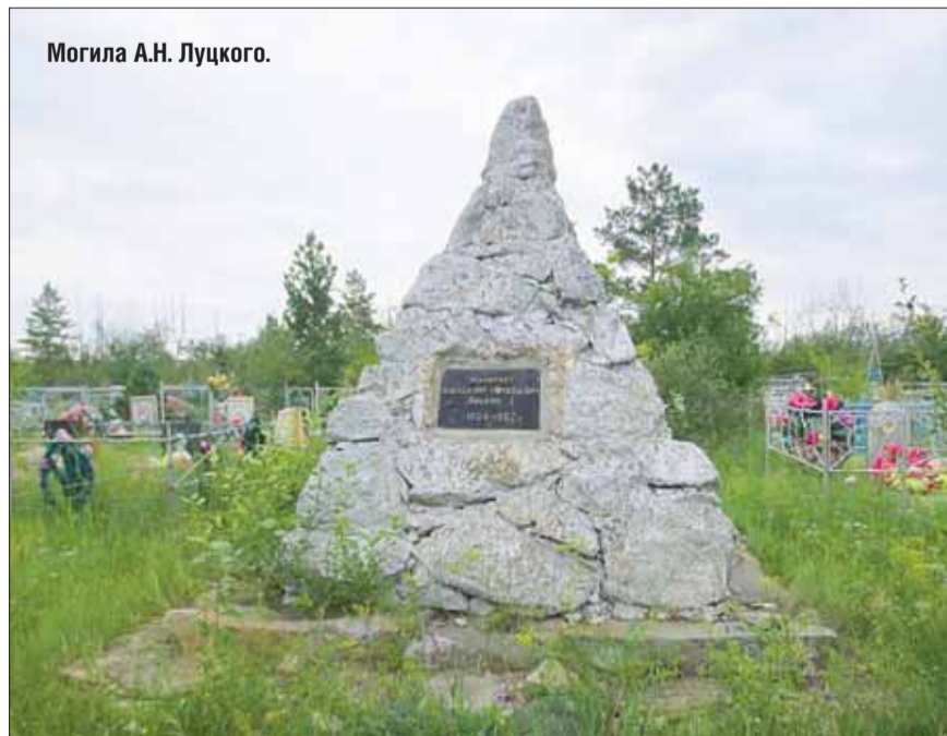
Могила А.Н. Луцкого.