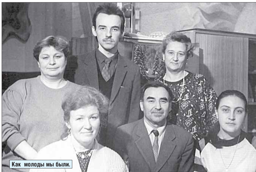
Как молоды мы были.

В 2015 году газете «Позиция» исполняется двадцать пять лет.